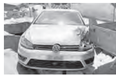
Beim Unfall wurde der Autolenker leicht verletzt.

bination an. Ein nachfolgender Autofahrer bemerkte dies zu spät, worauf es zur Auffahrkollision kam. Beim Unfall wurde der 21-jährige Lenker leicht verletzt und musste durch den Rettungsdienst ins Spital gebracht werden. Am Auto und dem Sachtransportanhänger entstand Sachschaden von einigen Zehntausend Franken.