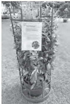
Eine von Einfamilienhausbesitzern oft verwendete, fremdländische und stark invasive Problempflanze ist der Kirschlorbeer.

Bereits zum zweiten Mal wird vom 26. Mai bis zum 1. Juni 2020 die Ausstellung «Invasive Neophyten» in Frauenfeld zu Gast sein. Beim Maitlibrunnen können Besucherinnen und Besucher die unerwünschten Pflanzen ansehen. Am Freitag, 29. Mai 2020, wird die Ausstellung zwischen 15 und 17 Uhr von Fachpersonen betreut. Invasive Neophyten sind gebietsfremde Pflanzen, die durch menschliche Aktivitäten eingeschleppt werden, sich sehr schnell vermehren und die einheimischen Arten verdrängen. In der Ausstellung werden 15 Arten gezeigt. Zu invasiven Neophyten, die in der Schweiz weder verkauft noch neu gepflanzt werden dürfen, gehören beispielsweise die Nordamerikanische Goldrute, Riesenbärenklau und Ambrosia. Pflanzen, auf die Hobbygärtner und Einfamilienhausbesitzer unbedingt verzichten sollten, sind Sommerflieger, Kirschlorbeer, Götterbaum und Seidiger Hornstrauch. (svf)