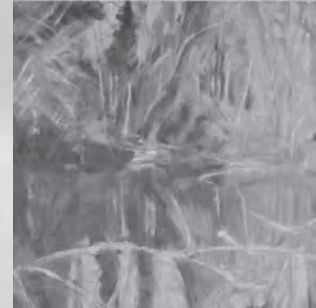
Acryl und Tempera auf Hartpavtex, 64 x 78 cm