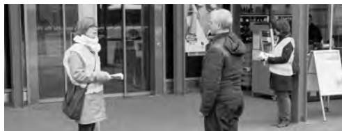
Die «Hebed Sorg-Paten» sprechen vor dem Einkaufszentrum Passage proaktiv Passanten an, sich an die Vorgaben des Bundes zur Eindämmung des Corona-Virus zu halten.

Mit dem Einsatz von «Hebed Sorg-Paten» setzt die Stadt Frauenfeld ein weiteres Zeichen im Kampf gegen die Verbreitung des Coronavirus. Die «Hebed Sorg-Paten» – alles Mitarbeiterinnen und Mitarbeiter der Stadtverwaltung und ihrer Betriebe – sind derzeit in der Stadt unterwegs und sprechen Passanten proaktiv an, sich an die Vorgaben des Bundes zu halten. Sie erinnern die Bevölkerung an die Massnahme «Abstand halten» und dass neu Treffen von mehr als fünf Personen im öffentlichen Raum verboten sind. Zudem bedienen sie ältere Menschen, die sie beim Einkaufen antreffen, mit einem Flyer der freiwillig organisierten Nachbarschaftshilfe der Stadt Frauenfeld und ermuntern sie, diese Dienstleistung