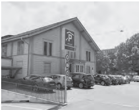
Die Parkplätze der Kantonsangestellten würden in die Tiefgarage verlegt werden.

Kantonsbaumeister Erol Doguoglu bestätigt diese Ausgangslage. Man habe sich diesbezüglich bereits mit der Stadt getroffen: «Wir sind grundsätzlich offen für dieses Anliegen. Dabei müssen zwei Fragen geklärt werden. Einerseits aus rechtlicher Sicht, andererseits aus finanzieller Sicht.» Was den ersten Punkt betrifft, so hatte sich die Stadt am Bau des Parkhauses Altstadt bekanntlich mit 2 Mio. Franken beteiligt, damit mindestens 60 öffentliche Parkplätze erstellt werden. Somit dürfen diese Parkplätze nicht einfach fix durch Mitarbeiter des Kantons belegt werden. Auf der anderen Seite dürften die monatlichen Mietgebühren der Kantonsangestellten die – maximal möglichen –